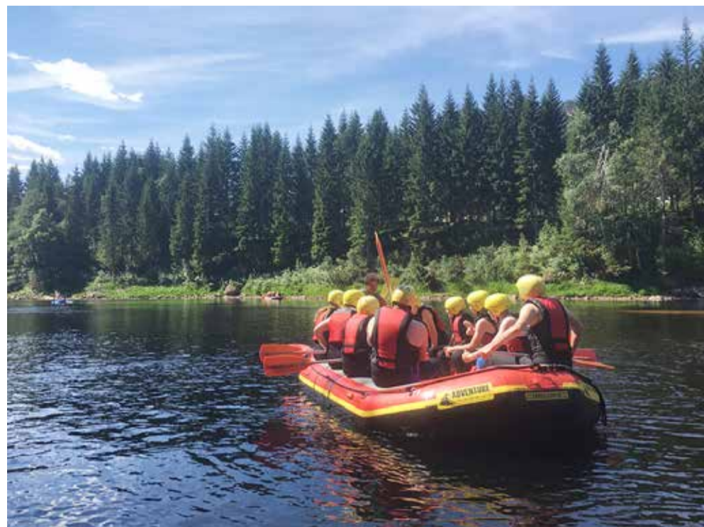
Riverrafting på Mandal Elva.

Et andet år var jeg med norske spejdere på rundrejse på Island, for vi skulle gennemføre den gamle engelske spejderdisciplin "Explorer Belt". 200 kilometers vandring på Island, samtidigt med at man skulle løse opgaver undervejs, ved at tale med lokalbefolkningen for at opklare lidt om Island.