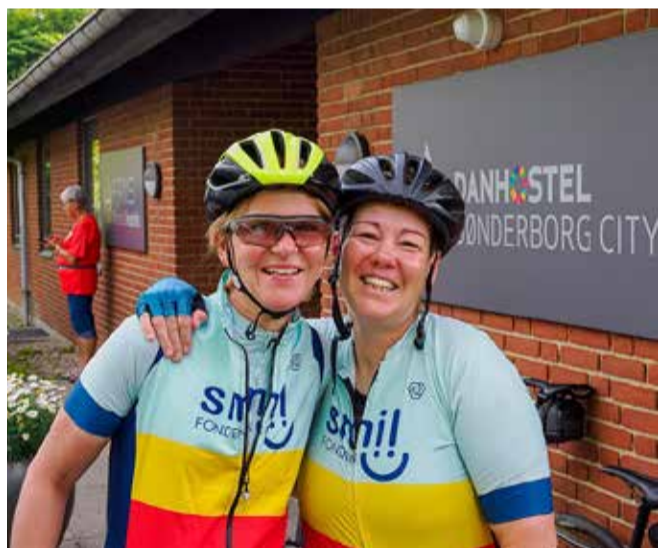
Efter 150 km er der stadig smil på og tid til tøjvask og hygge inden middagen.