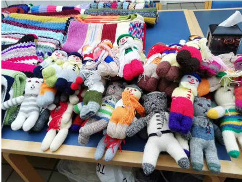
Strikede bamser som bliver uddelt i vore fængsler.

Vi har en deltager som strikker strømper, 200 - 300 par om året. En anden strikker bamser. De bliver uddelt i vore fængsler. De indsatte kan så forære deres børn en "kramme bamse" når de kommer på besøg. Ellers er det tæpper,