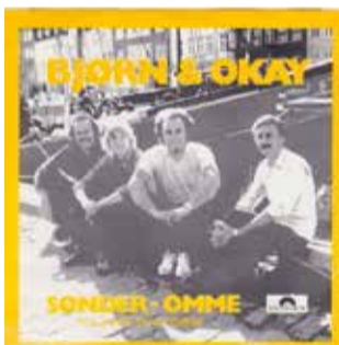
Indspillet i 1982.

Midt i Jyllands hjerte ligger Sdr. Omme, skov og hede dækker jordens areal. Vær velkommen hver en gæst til hid at komme! Livet her er langt fra nogen jammerdal! Imødekommende og gæstfri det er byen, og samarbejde, sammenhold vi sætter højt, går ind for nye tanker, kreativ fornyen, blot vi står sammen er vi alle velfornøjt!