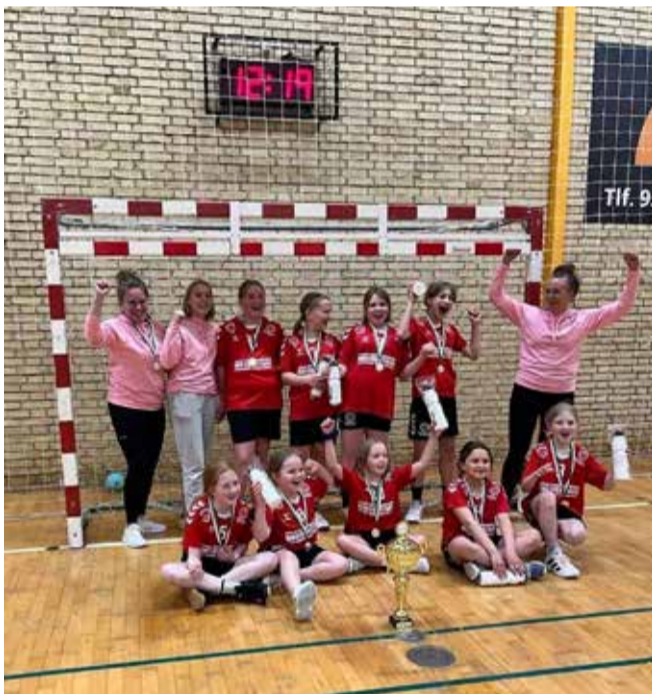
Sjov træning fører også til sejr, som her ved Soldacup 2022, hvor pigerne vinder 1. pladsen og tager hjem med en pokal.

Indtil uge 42 træner vi hver torsdag fra kl 16.45 - 17.45 og det vil glæde os at se flere piger, som vil være en del af et fantastisk sammenhold med fede stævner i vente.