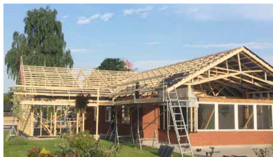
Udskiftning af spær og tag

I dette projekt har vi efterisoleret ved skråvægge, så isoleringen overholder gældende regler. Lofterne er monteret med fibergips samt akustikfelter. Køkkenet som er monteret af os, er et Tvis køkken, hvor vi er certificerede køkken montører. Her har vi også lavet alt malerarbejdet.