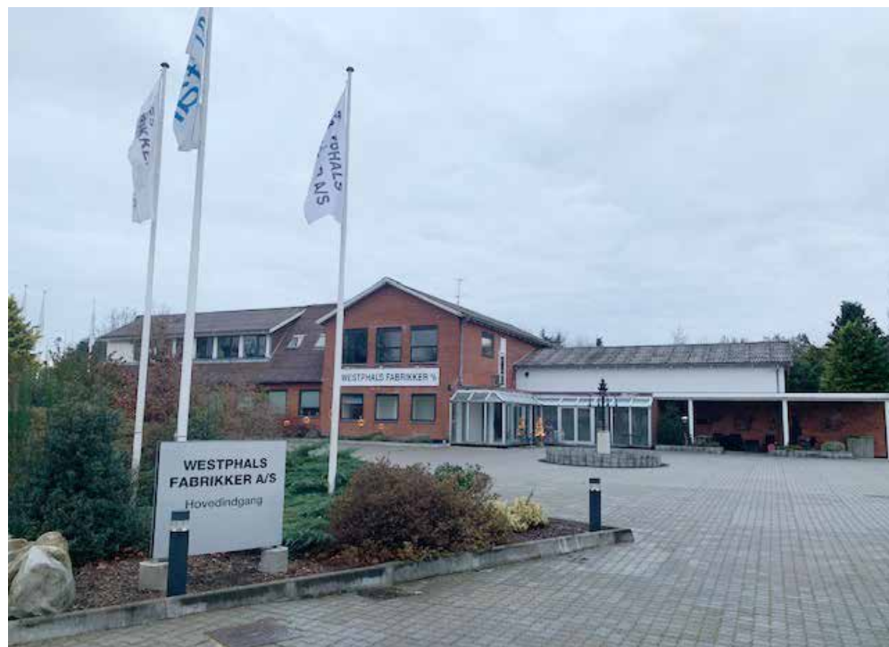
Tekst og foto: Westphals Fabrikker A/S