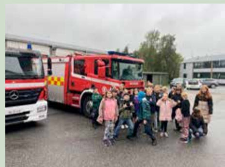
Mellemgruppens besøg på brandstation.

I den forbindelse blev det til et besøg på Fredericia Brandstation.