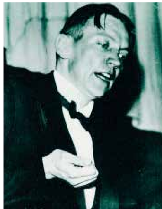
Digterpræsten Kaj Munk fra Vedersø Præstegård.