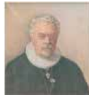
Biskop Oluf Olesen, Ribe.