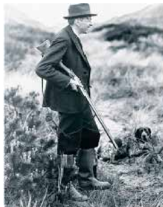
Kaj Munk.