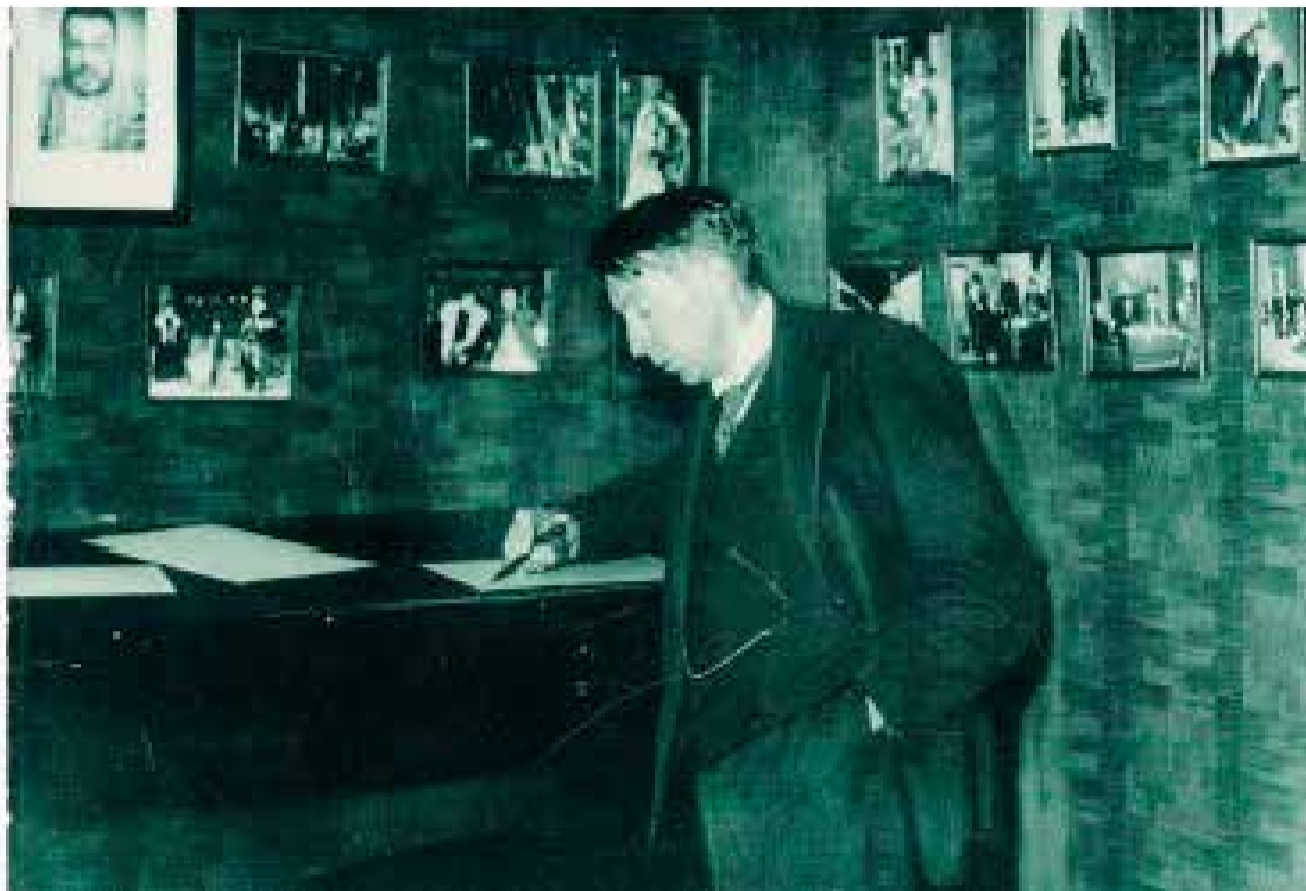
Kaj Munk