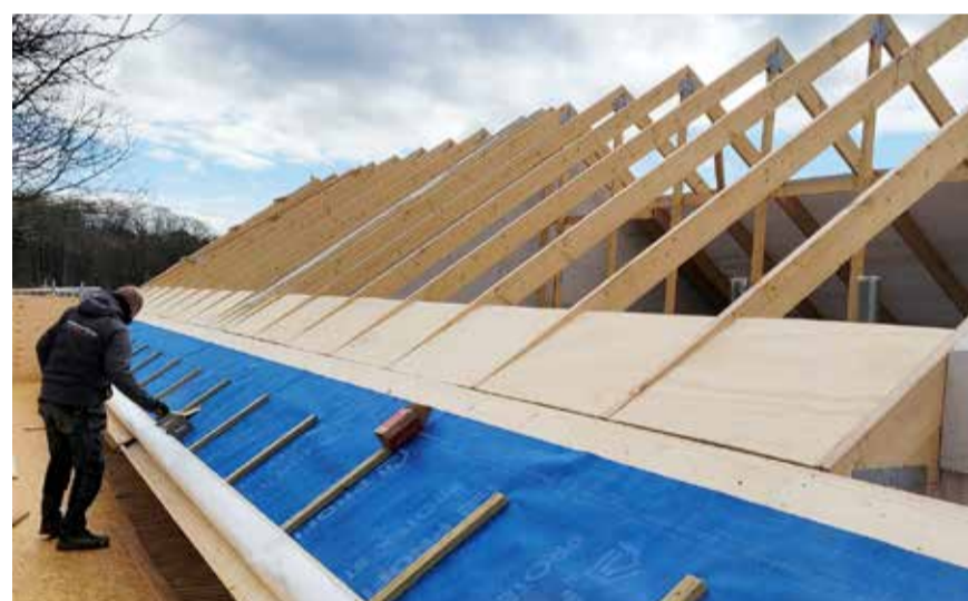
Entreprise på nybyg i Vejle

Her er der bygget en beboelses pavillion på 47 m 2 , som indeholder 3 værelser og badeværelse med badekar. Pavillionen kan flyttes med kran og fragtes i et stykke.