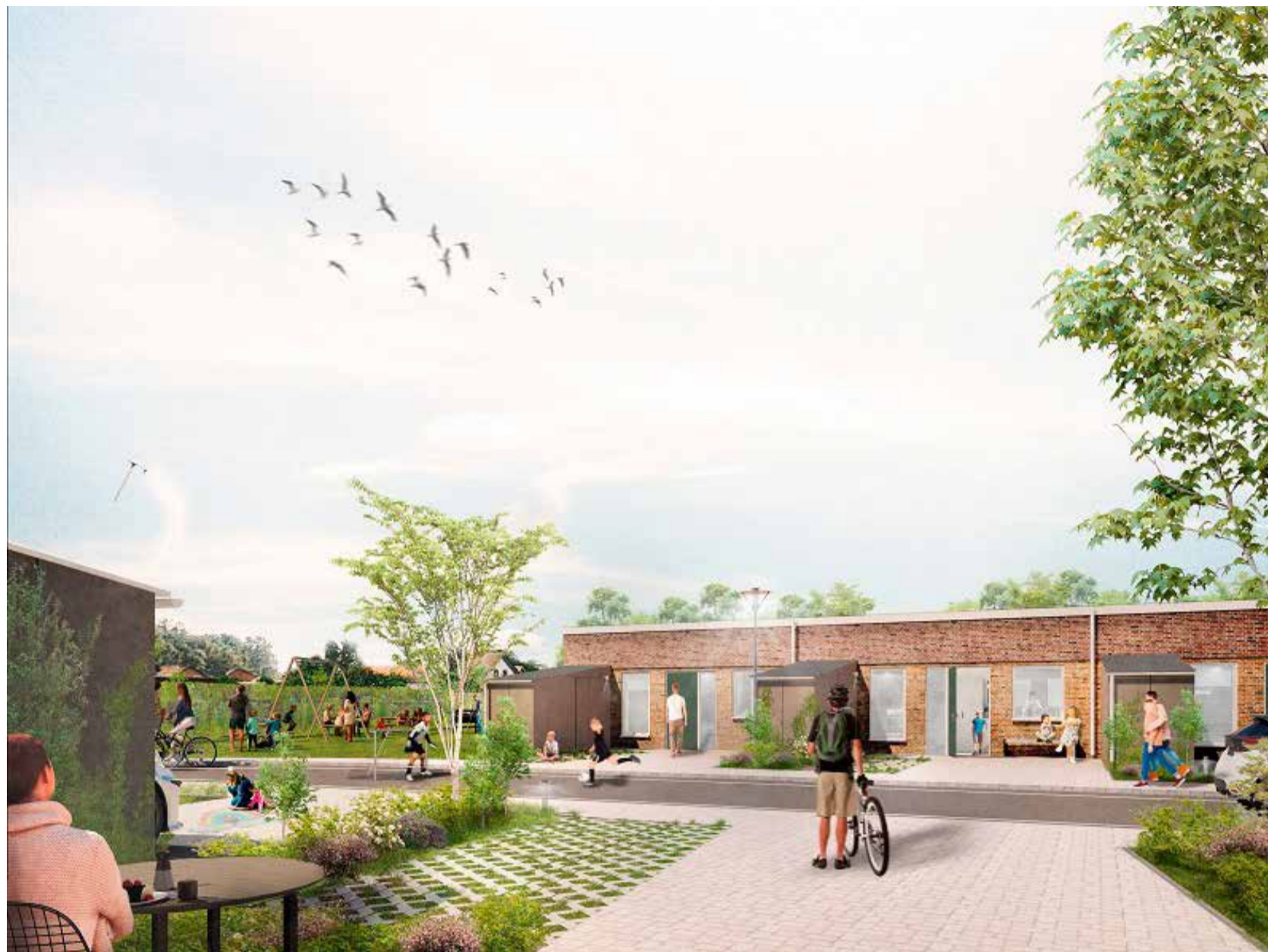
Troldeparken inde i området.

Grindsted Boligforening og Bovia er begejstrede over at kunne præsentere nybyggeriet, Troldeparken i Sønder Omme.