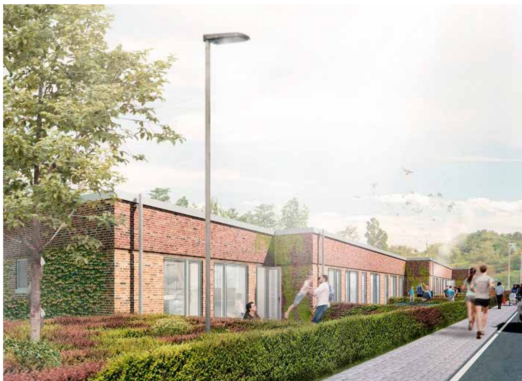
Troldeparken langs Rahbæksvej.

•At hver anden bolig tilbydes medlemmer, ud fra anciennitet i Bovia (almindelig venteliste).