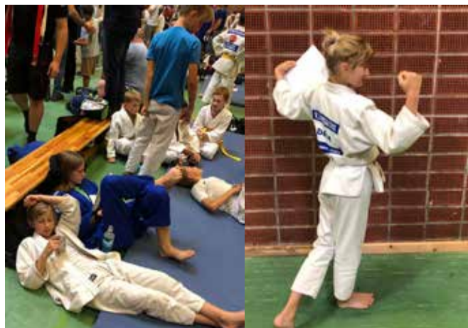
Venter på præmieoverrækkelse.