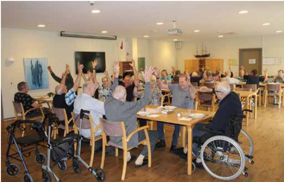
Beboerne på Filskov Fripnejehjem jublede, da de fik nyheden om, at deres plejehjem var indstillet til Danmarks bedste.

Omme Centret og Filskov Fripnejehjem vil være Danmarks bedste.