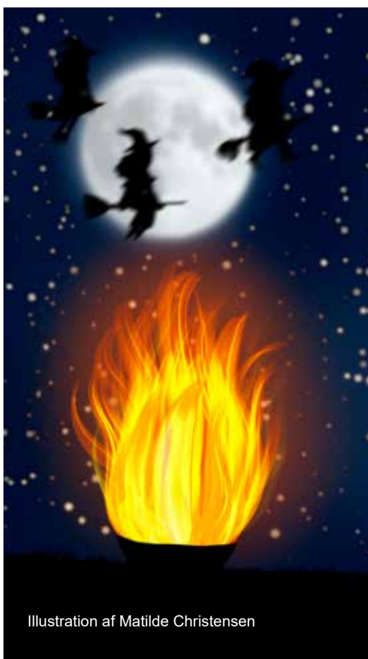
Illustration af Matilde Christensen