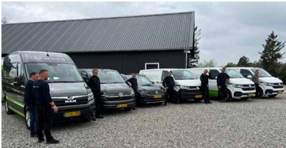
BC Energiservice har flere ansatte, som sælger, monterer og servicerer varmepumper.

BC Energiservice i Sdr. Omme har på få år skabt sig en solid position blandt installatørerne af varmepumper.