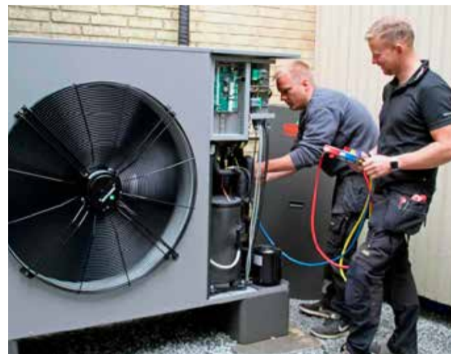
Igangsætning af én af de større varmepumper.