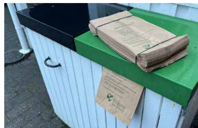
Man skal sætte pose i klemme i låget på skraldespanden til madaffald, hvis man vil have leveret ekstra poser.

Forsøget har ført til, at man fremover som borger automatisk får udleveret poser til madaffald hvert forår. Hvis man mangler ekstra, kan man året rundt sætte en pose i klemme, når man får tømt madaffald.