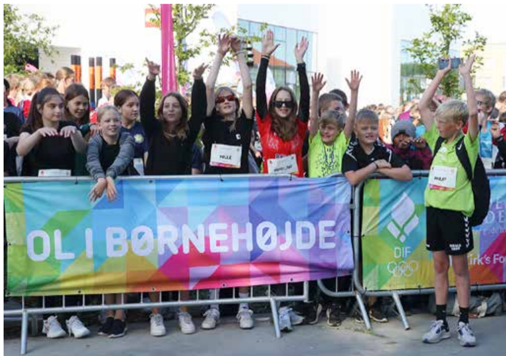
Når Skole OL kommer til Billund Kommune giver det også mulighed for at udvikle idrætsundervisningen til gavn for skoleelever nu og i fremtiden.