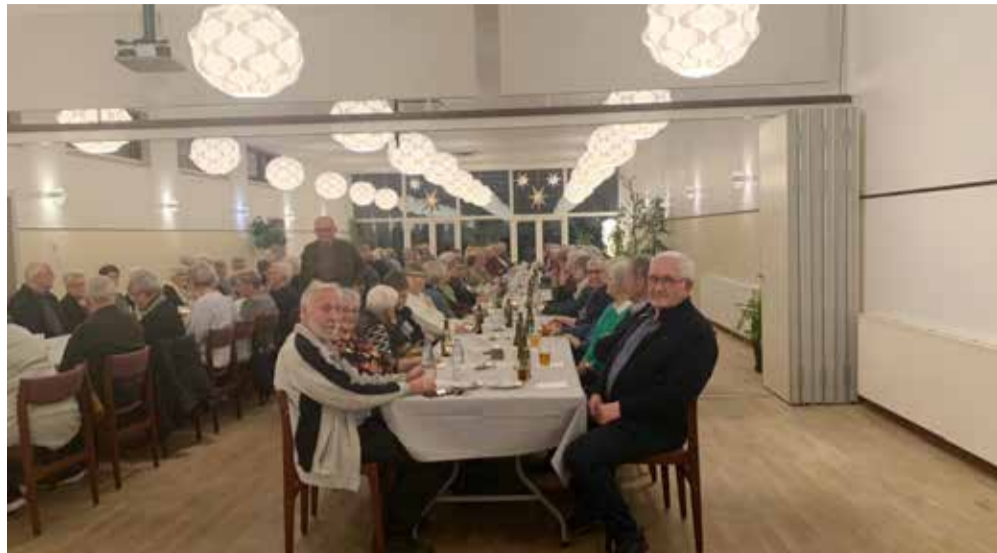
107 var mødt op for at høre foredraget med Henrik Dam Kristensen, som var arrangeret af Aktive Kvinder og Danske Seniorer Sdr. Omme..

Danske Seniorer og Aktive Kvinder i Sønder Omme havde mandag den 13. marts 2023 inviteret til foredrag med fhv. folketingsformand Henrik Dam Kristensen på Sdr. Omme Kro, og det er ham, som de også i daglig tale kalder "postbudet fra Vorbasse".