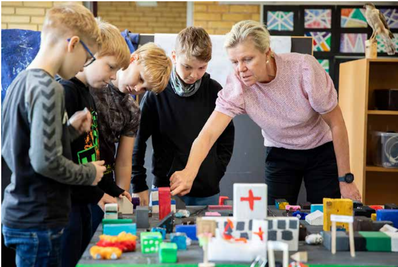
Fremover vil der være to voksne til stede i alle lektioner i 0. og 1. klasse. Formålet er at give børnene det bedst mulige læringsafsæt til livet.

Når skoleåret begynder i sommeren 2024, vil 0. og 1. klasserne i Billund Kommunes folkeskoler opleve, at der er to voksne til stede i undervisningen. Forskning peger nemlig på, at en målrettet indsats tidligt i livet ruste børnene bedre til fremtiden.