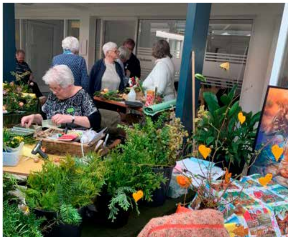
Fotos fra tidligere års Påskemarked på Omme Plejehjem.