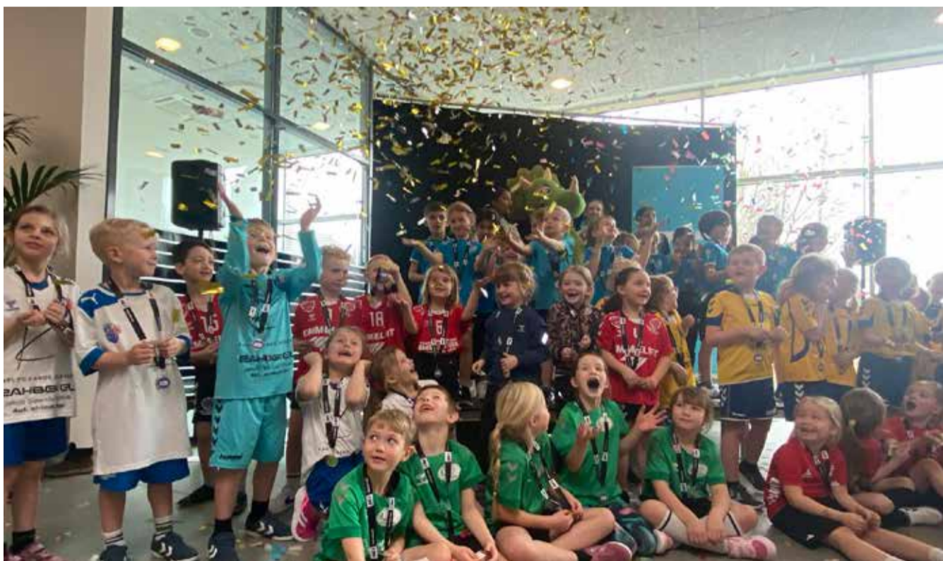
Overvældende gulfest i Grindsted. Det bragte glæde og smil til Sdr. Omme håndbold-børn.