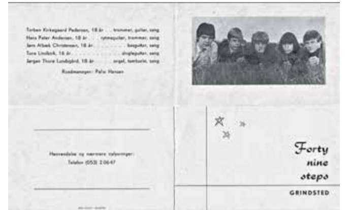
Gruppen Forty-nine steps visitkort - Privatfoto.

Ved et julearrangement i Billund havde Lego stillet en stor eksportlagerhal til