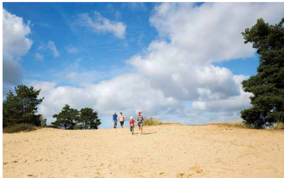
Billund Kommune igangsætter et arbejde med at udarbejde byprofiler for Billund, Grindsted, Sønder Omme, Filskov, Vorbasse, Hejnsvig, Stenderup-Krogager.

Billund Kommune vil udarbejde en række byprofiler for kommunens syv største byer, som giver en klar og fælles retning for udvikling af byerne. For hvad gør byerne til noget særligt hver for sig - og hvad binder dem sammen?