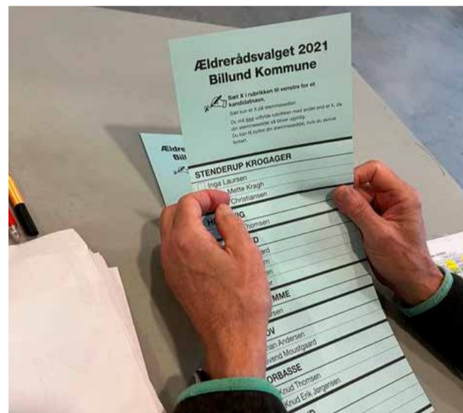
Billedet er fra valget i 2021.

"Ældreområdet står over for store forandringer og udfordringer de kommende år. Det kræver et stærkt ældreråd, der gennem samarbejde vil udvikle og kvalificere kommunens arbejde og beslutninger på området. Ældrerådet står stærkere med en god opbakning fra borgerne, derfor hå-