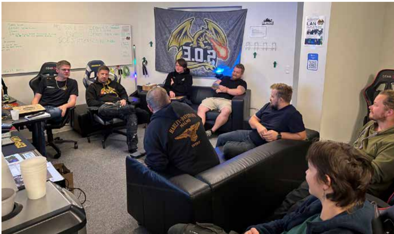
Frivillige i Sdr. Omme Esportsforening ved et af planlægningsmøderne op til deres LAN-Party arrangement, som afholdes i Multicentret fra den 10. - 12. oktober.