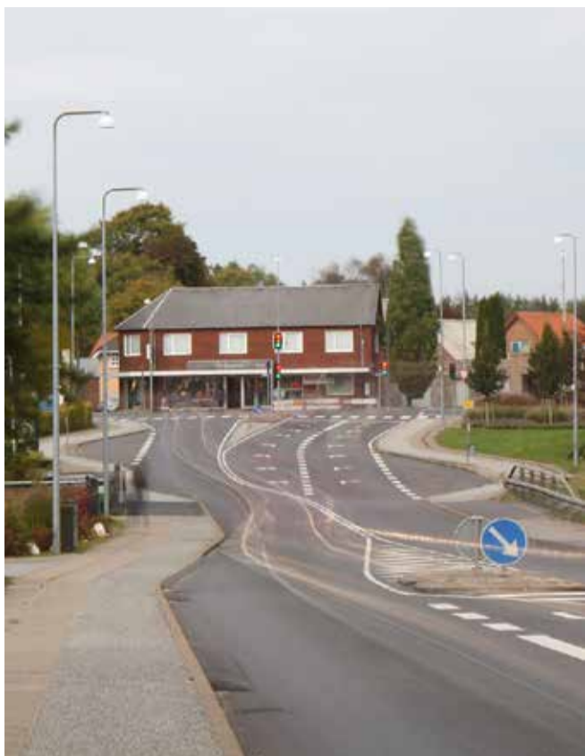
Henrik Thøstesen har taget ugens billeder. Dette spændende billede kalder han Indgangen til Sønder Omme . Henrik fortæller, "at billedet er taget med et special filter der gør, at det tager over et minut at tage billedet og derfor fremstår biler som lysende streger i billedet og træer bliver slørede".