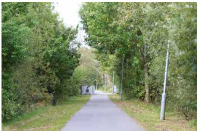
Jernbanen. Dette billede er taget et stykke fra Holdgårdsvej op mod Vejlevej hen over Omme-Å broen via den gamle jernbane.