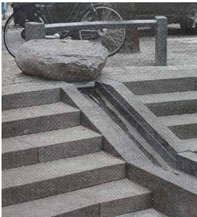
Stille og roligt piblede vandet frem og løb ned ad trappen.