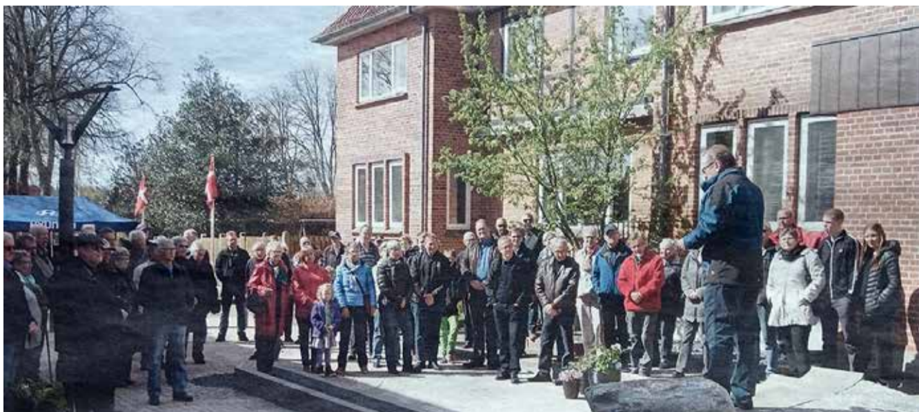
Sdr. Ommes nye akse blev indviet lørdag den 2. maj 2015.