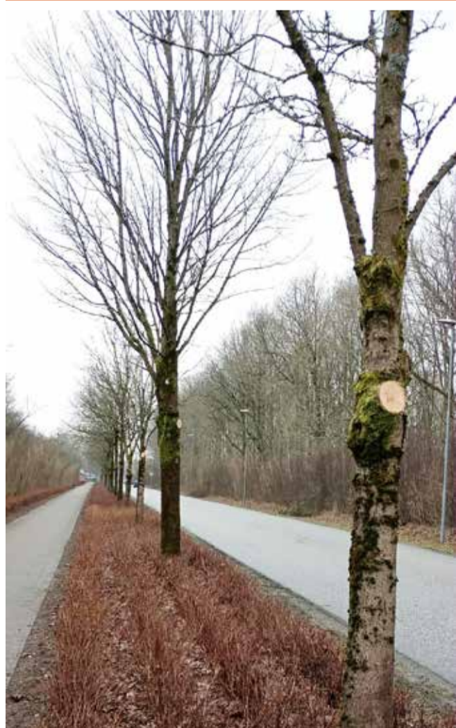
FORÅRSKLARGØRING I SDR. OMME

Træerne langs Bøvlvej er blevet opstammet og buskene studset.