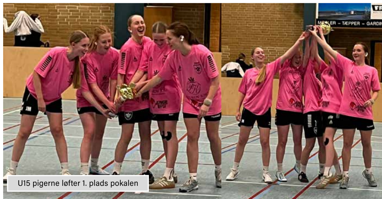
U15 pigerne løfter 1. plads pokalen