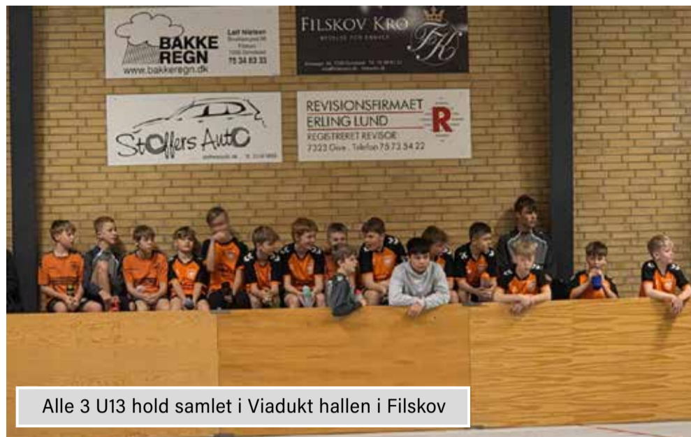
Alle 3 U13 hold samlet i Viadukt hallen i Filskov