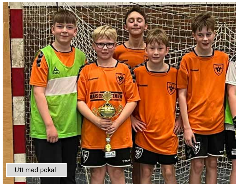
U11 med pokal