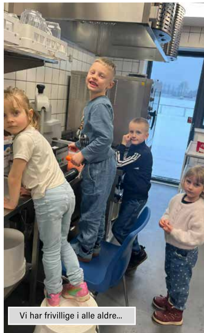
Vi har frivillige i alle aldre...

I Sdr. Omme hallen, på skolen og i multisalen har frivilligheden nået sin top. Under hele stævnet har mange frivillige været i gang, og et TAK er kun et