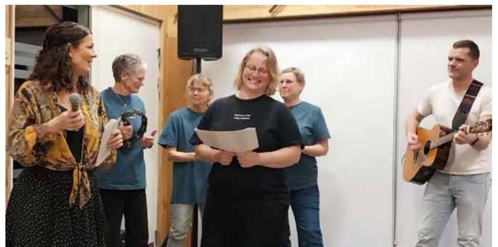
Hyldest til de frivillige der står for Naturrum arrangementerne.