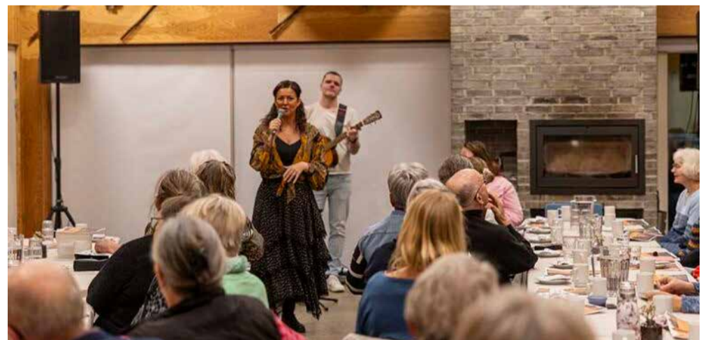
Fællessang i Naturrum.