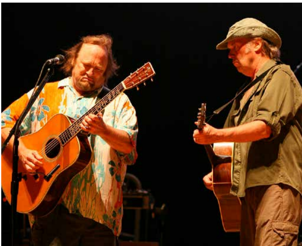
Stephen Stills og Neil Young på turné 9. august 2006 som en del af Crosby, Stills, Nash og Young.

Jeg håber I læsere orker at høre mere om Neil Youngs karriere. Jeg har i hvert fald i sinde, at fortsætte i næste uge.