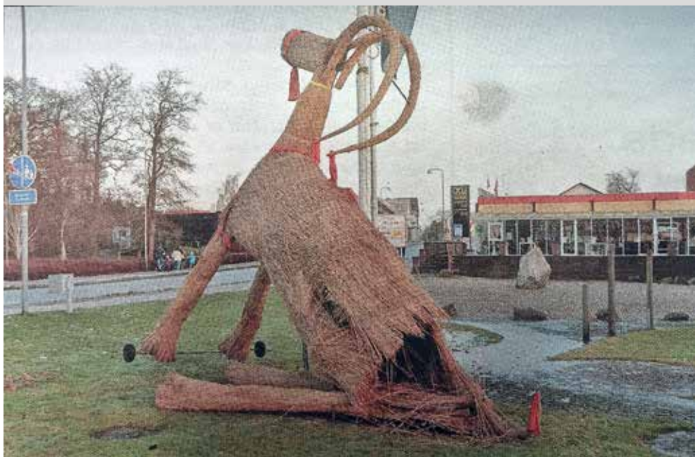
Den gamle julebuk er blevet træ - træ af groteske nytårsløjer, som igen i år har været årsag til, at julebukken skal have den helt store renovering, førend den kan tage plads i byen igen til jul. (Foto: Jesper Thorne).

Uddrag fra artikel 5. januar. - Af Jesper Thorne.