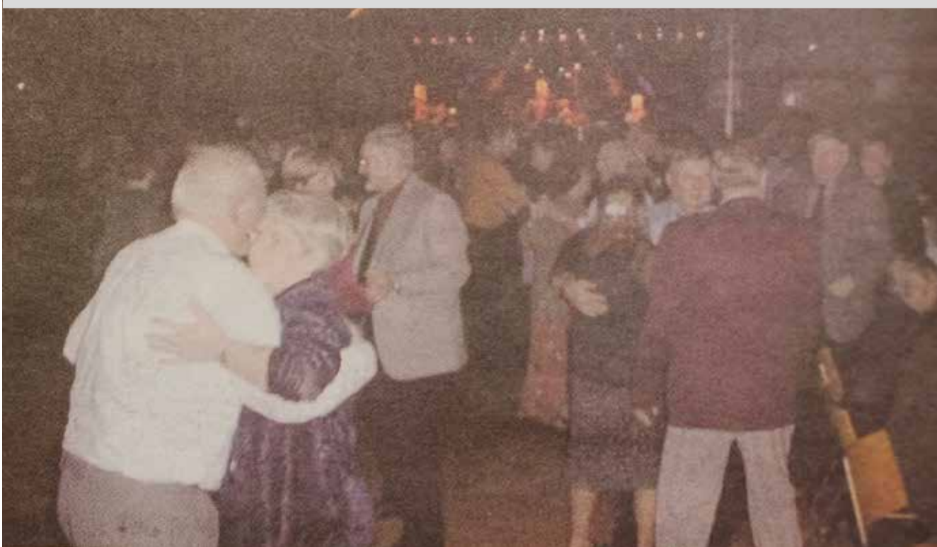
Der var mere end trængsel på danseguldet da Kandis spillede op til nytårsbal i Sdr. Omme