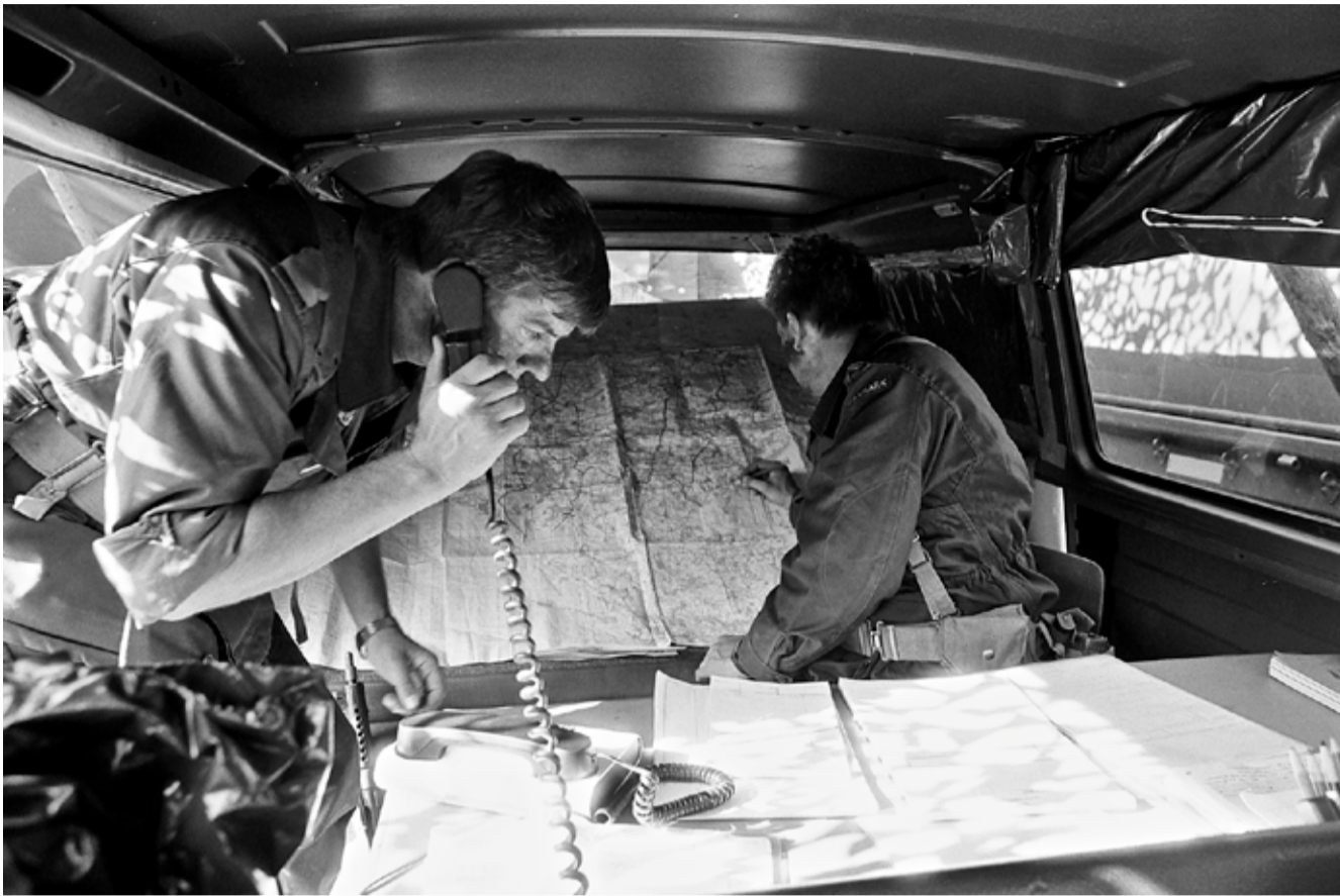
En kommandostation fra 2. Sjællandske Brigade under øvelsen 'Avenue Express' i juni 1989. På kortet kan skimtes den danske forsvarsplan. Foto: Forsvarsgalleriet.

Presse: Det Kgl. Bibliotek, Rigsarkivet og Langelands Museum.