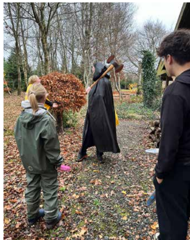
Også de voksne leger med