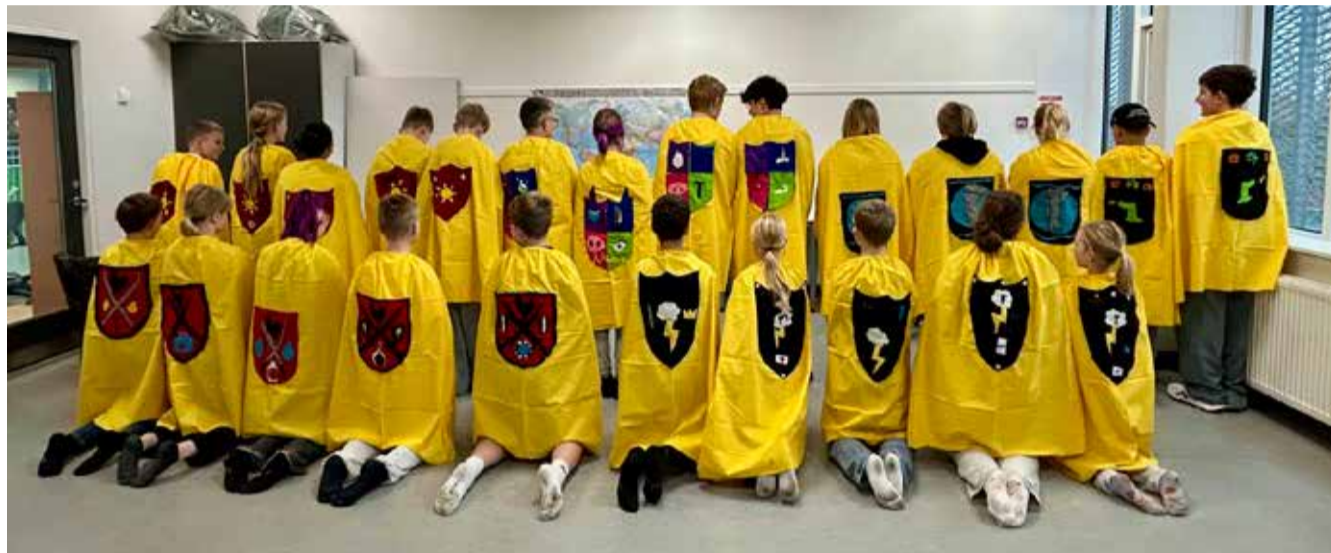
6.a. flotte kapper med eget design af våbenskjold.