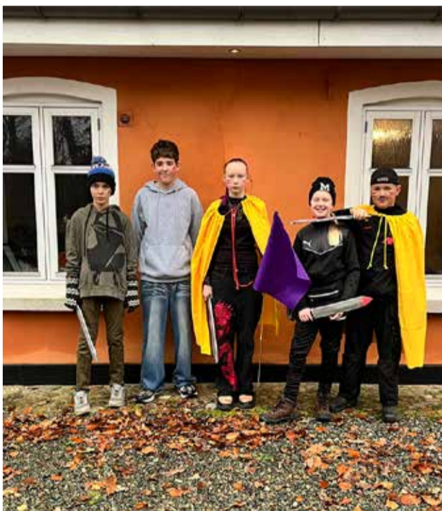
Klanerne gør klar til kamp.

Der var råb og en hujen i hele skoven. Sikke en dag! 6. klasse viste til fulde, at de kan bruge både fantasy og leg i en herlig sammenhæng.