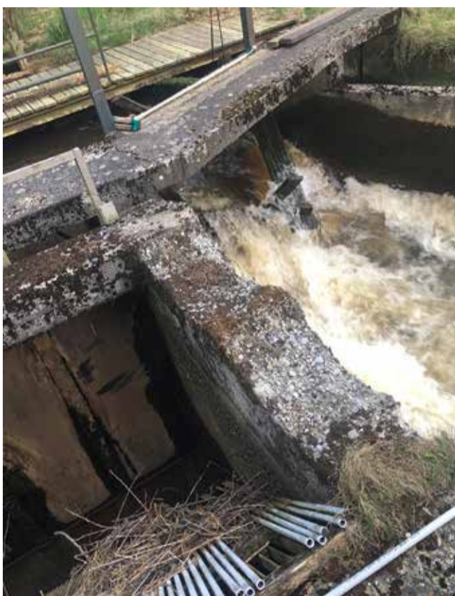
Vandet fra den lukkede turbine.

Jeg vil senere berette om Juellingsholms interessante forhistorie.