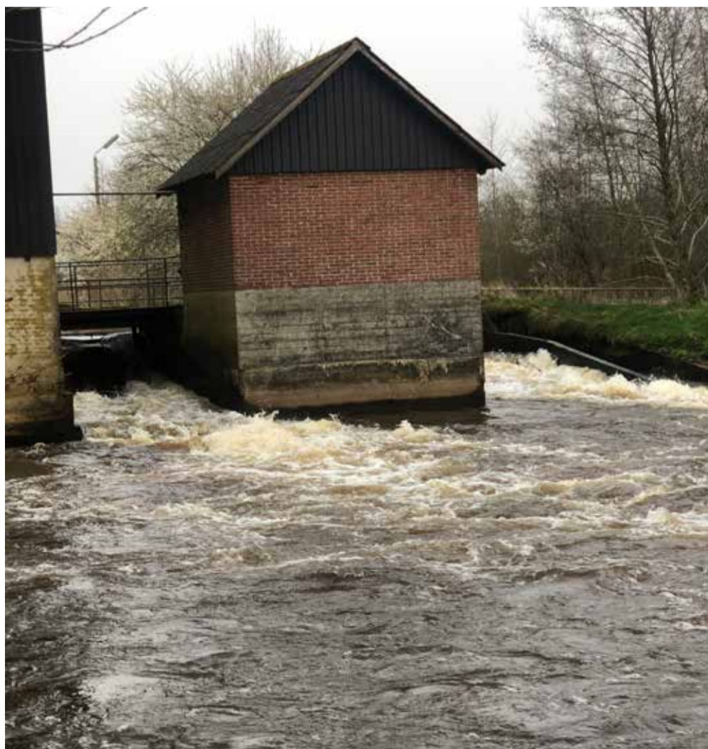
Vandkraftværket set fra vest.