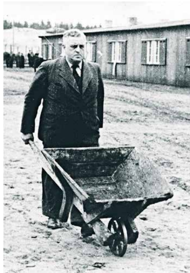
Frits Clausen som fange i Fårhuslejren.

Med Frits Clausens ord i bogen Føreren har ordet!: Frits Clausen om sig selv