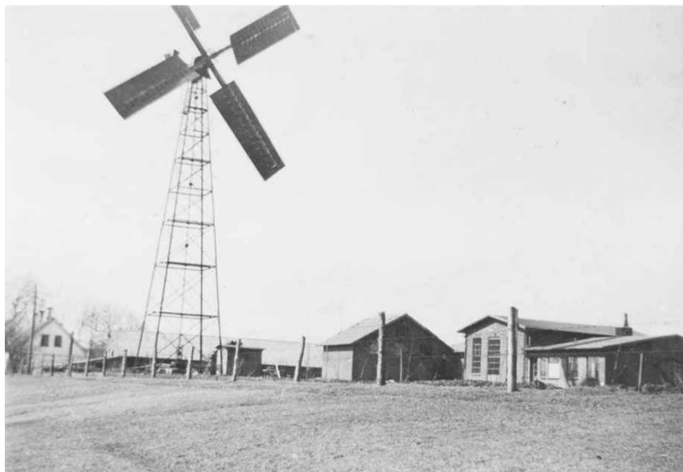
Vindmøllen ved Vejlevej i Sønder Omme.

Turbinen ved vandkraftværket leverede under krigen ca. 3/4 af strømproduktionen; den viste sit værd. Der blev derfor indsat ny turbine i december 1945. Det første år ydede den 189.000 kWh. På Vejlevej udbyggedes efter krigen i 1948 med en dieselmotor fra