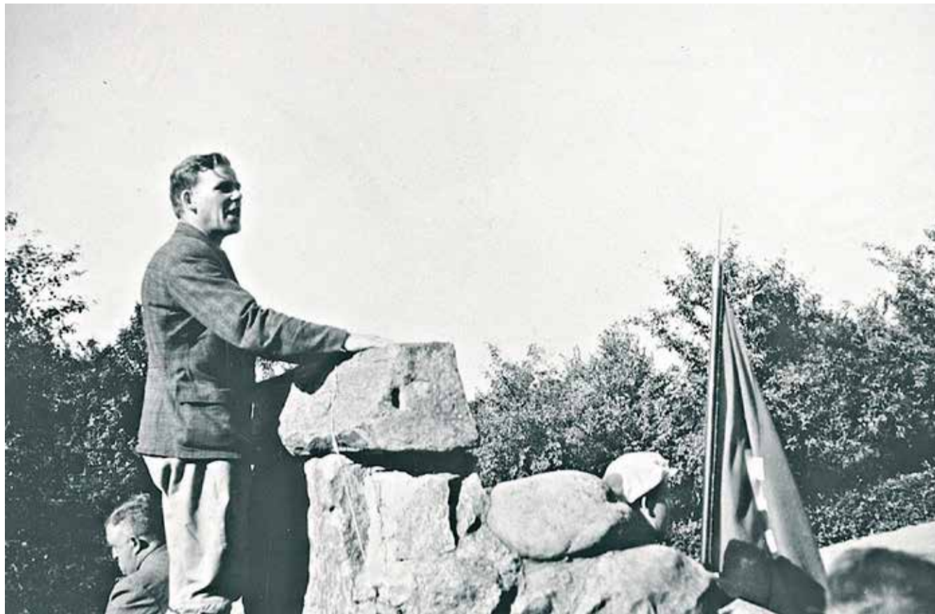
En taler ved Frits Clausens møde i Grindsted

Det martrer fortsat den europæiske folkesjæl, at ingen i forbindelse med Nazityskland og Den Anden Verdenskrig havde modet til at gribe ind og ændre historiens gang.