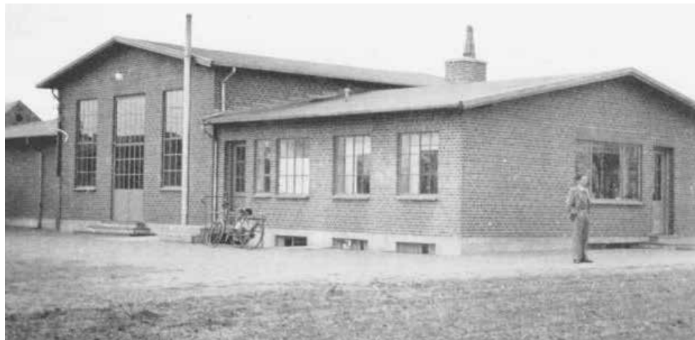
Elværket på Vejlevej i Sønder Omme.

Lokalerne blev bygget, og de gamle motorer fra Juellingsholm samt to nye blev indsat på Vejlevej. I 1937 starter værket op med hele 143 kW. Pri-