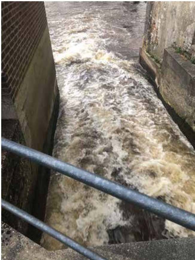
Vandet fra den lukkede turbine.

en undervandsbåd. Så der var efterhånden en del maskiner til at frembringe elproduktionen. Alligevel kunne Peder Steffen godt se, hvad fremtiden indebar. I 1951 besluttede han derfor, at i løbet af de næste 10 år skulle elnettet købes af forbrugerne, og produktionen overgå til kraftværkerne. Hermed skulle jævnstrøm også erstattes af vekselstrøm. Dette skete så 26. oktober 1961. Elproduktionen ved vandkraften fortsatte dog. Man forsynede husene ved Juellingsholm.