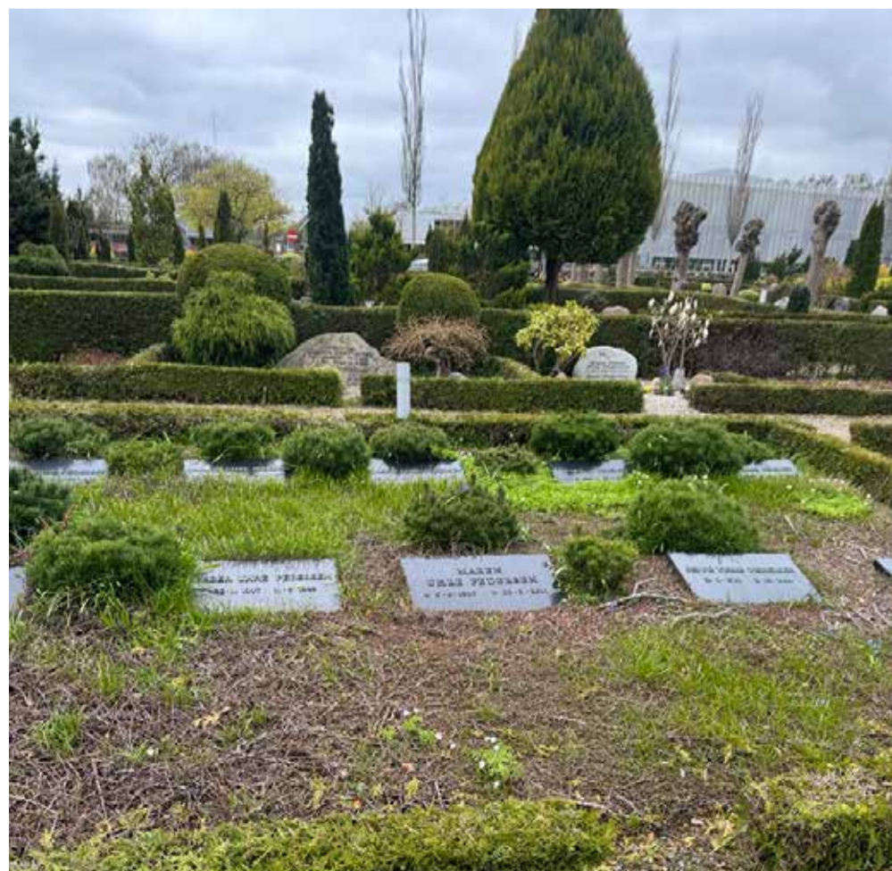
Familiens gravsted på Sønder Omme kirkegård.