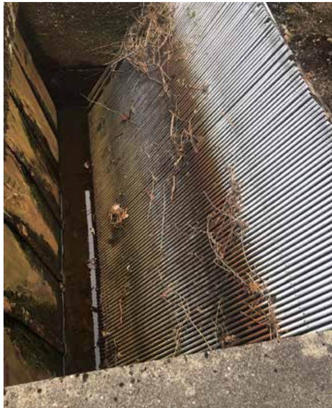
Indgang til den lukkede turbine.